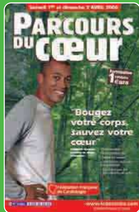
Affiche des Parcours du Cœur 2006

À cette occasion, nos cardiologues informent également le public sur l'impact du tabac et des autres « bourreaux du cœur » que sont le cholestérol, le diabète et l'hypertension artérielle, et donnent des conseils pour une alimentation équilibrée.